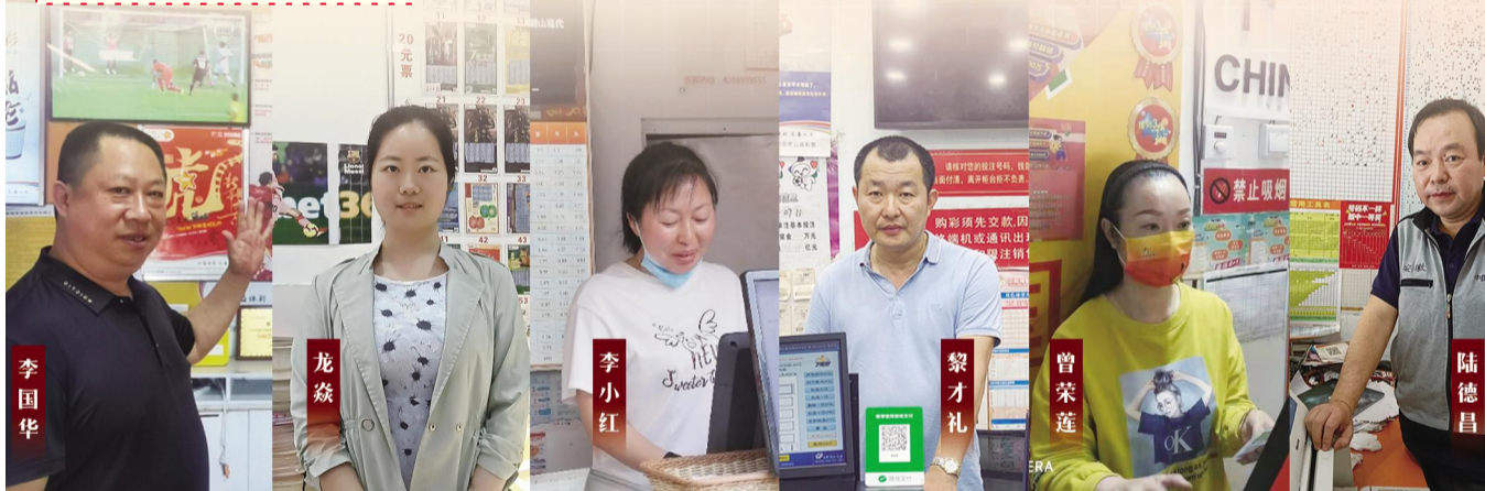
制图 / 张俊峰